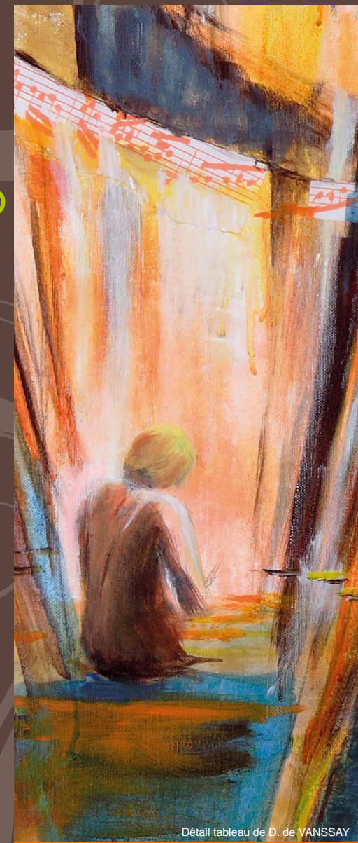
Détail tableau de D. de VANSSAY